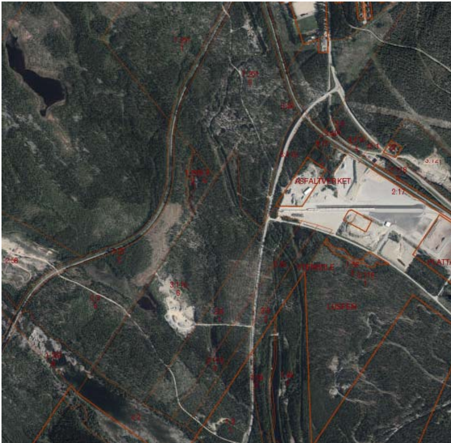
Ortofoto över området.

Miljö- och samhällsbyggnadsnämnden beslutade 2015-02-18, § 7, att upprätta detaljplan med utökat förfarande för triangelspår. Behovsbedömning för triangelspåret har under april/maj 2015 varit utsänd för yttrande till Länsstyrelsen, Trafikverket och berörda samebyar. Området tänkt att planeras i etapper, triangelspår etapp 1 och industriområde etapp 2. Industrimarken ska utveckla omlastningscentralen då tre företag har tecknat avsiktsförklaring om att etablera verksamhet.