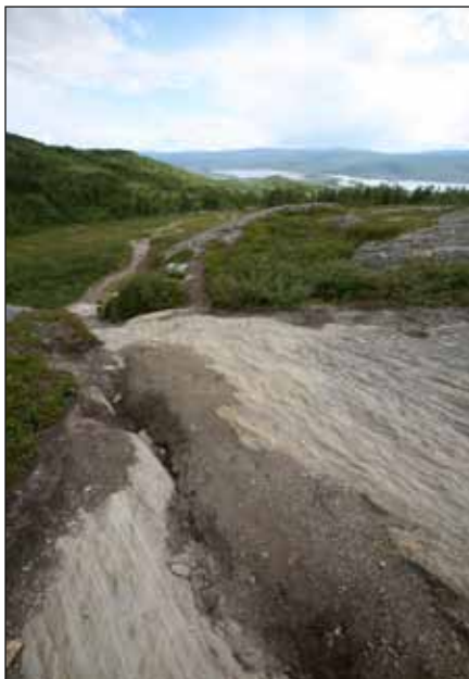
Drottningleden med utsikt mot Laisaliden

Stigen har funnits mycket länge, men 2003 namngav Drottning Silvia den genom en invigningscermoni. I Hemavan startar Drottningleden uppe vid Fjällparken och Högfjällshotellet. Starten är väl skyltad.