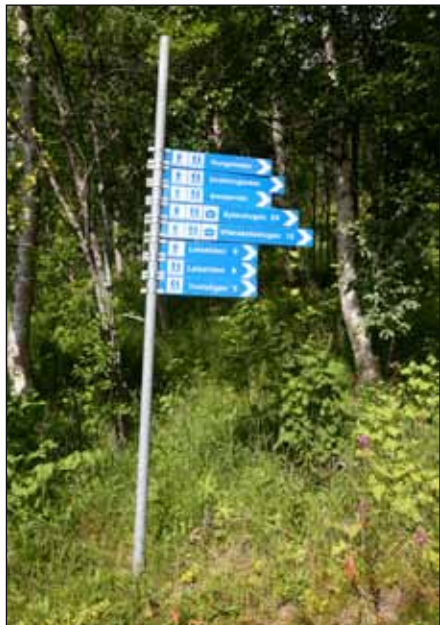
Skyltar vid starten i Hemavan

Denna led som går mellan Laisaliden och Hemavan är relativt lättvandrad. Det är också populärt att ta en löptur längs leden och vintertid åker man både skidor och skoter.