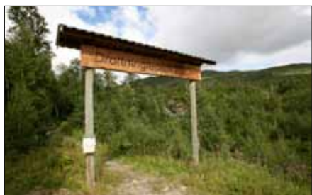
Ledens start i Laisaliden

Första sträckan går tillsammans med Kungsleden, efter ca 500 m delar de på sig åt olika håll. Drottningleden går nu i sydlig riktning över bron vid Mortsbäcken vidare mot Laisaliden. Efter en rejäl uppförsläp genom björkskogen sker resten av vandringen på kalvfjället. Leden är markerad och vandras genom lätt terräng. Den sägs också gå över De Sju Små Bergen och är en mycket välbesökt kalvfjällsled. I Laisaliden är leden väl skyltad och det finns gott om parkeringar.