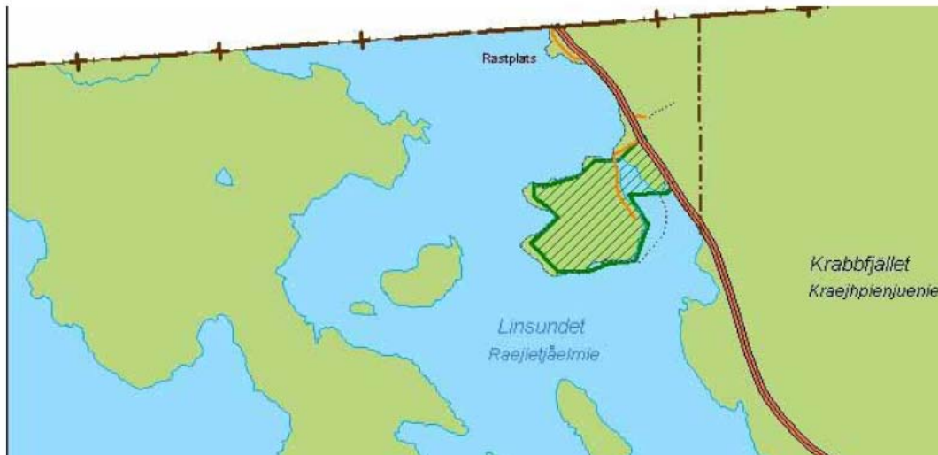
Utdrag från gällande LIS-plan