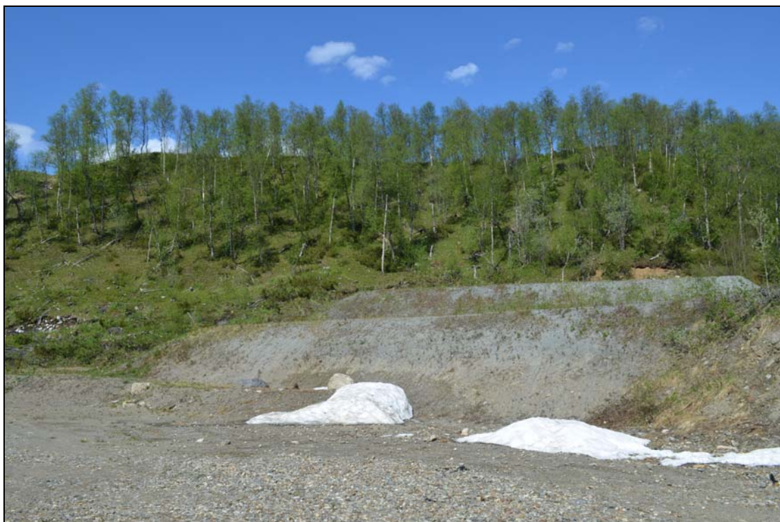
Området där snöhus utgår och blir naturmark.