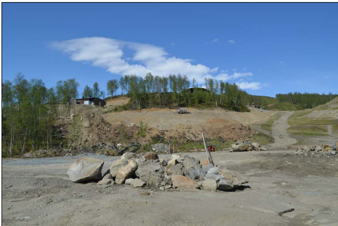
Foto tagit i riktning mot där nya bostäder planeras för, Fjällforsvägen.