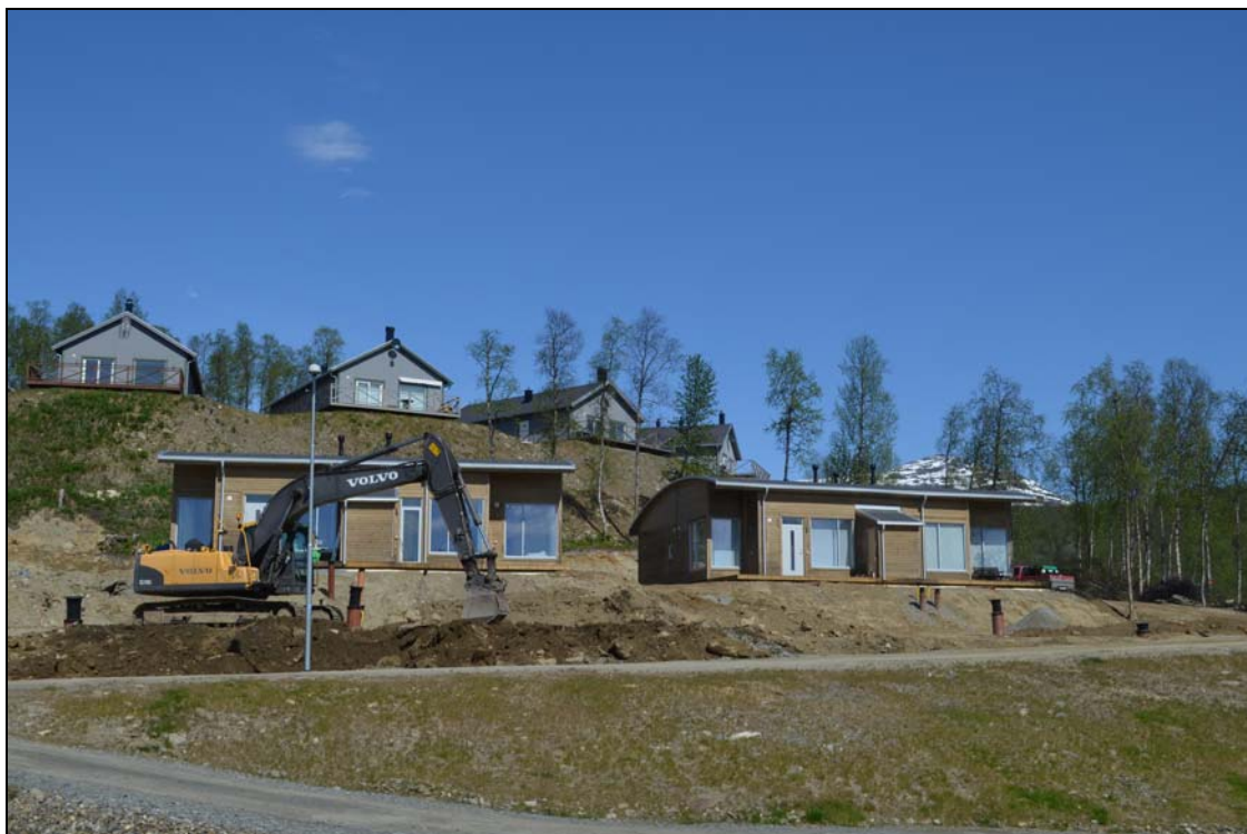
Foto taget juni 2016. På bilden syns befintliga bostäder vid Fjällutsikten (övre området) samt bostäder vid Kungshagsvägen.