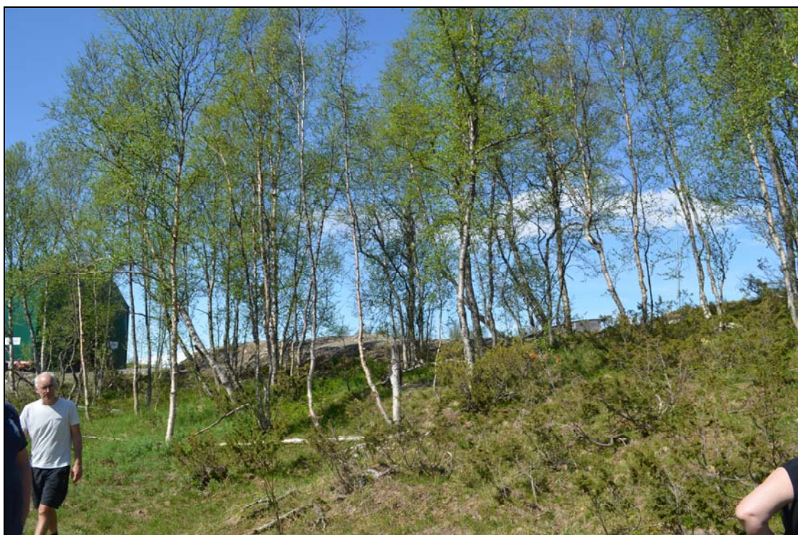
Område för komplettering av nya bostäder vid Kungshagstigen.