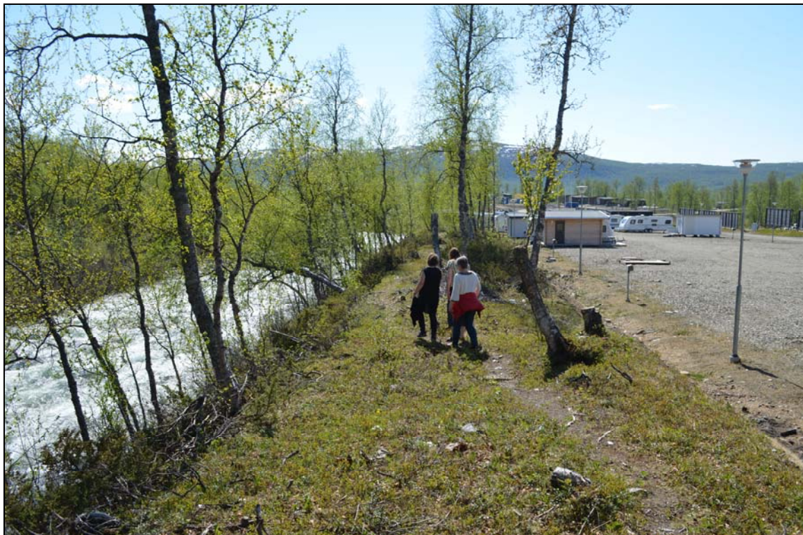
Befintlig stig efter Mortsbäcken som ska iordningställas. Till höger i bild ses campingplats.

En barmarksbesiktning har skett av förvaltningschef/stadsarkitekt, planerare och planhandläggare våren/sommaren 2016. Marken utgörs av allt från plan mark till sluttande terräng.