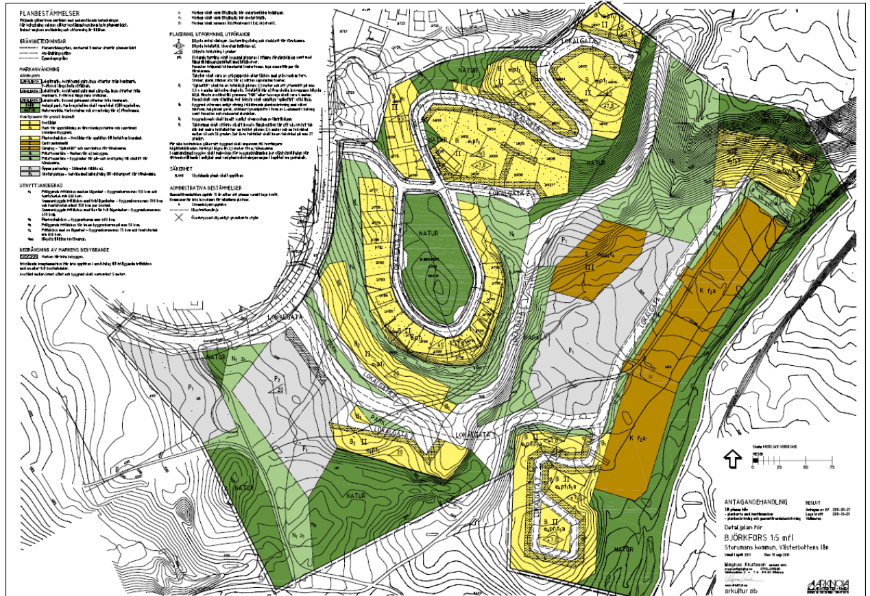
Utdrag från gällande detaljplan, fastställd 2011.

Fastigheterna ligger inom detaljplanelagt område. Den aktuella planen kommer helt att ersätta detaljplan fastställd 2011-09-27, Detaljplan för Björkfors 1:5 mfl (kommunens beteckning 1:48).