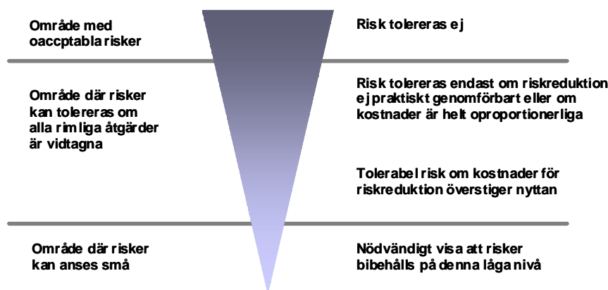
Figur 1 Princip för uppbyggnad av riskvärderingskriterier (Räddningsverket, 1997).

Det är nödvändigt att skilja på två grupper av personer när kriterier för risktolerans diskuteras för människors liv och hälsa. Dessa är dels personer ur allmänheten, s.k. "tredje man" och dels personer med anknytning till den analyserade riskkällan.