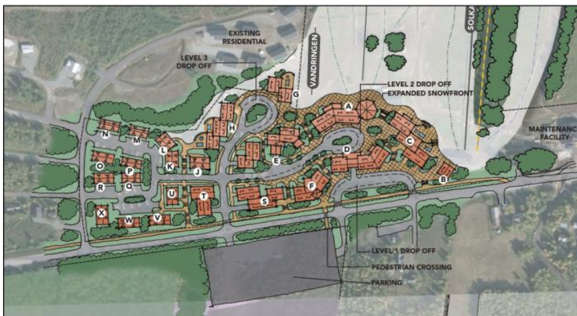
Fig 2, Områdesöversikt

Det aktuella området ligger på norra sidan om väg E12 i västra delarna av Hemavan i Storums kommun, se Figur 2 nedan. På området finns idag Restaurang Solkatten samt camping. Dessa kommer i och med föreslagna etablering att försvinna. På området planeras Alpint centrum, vilket inkluderar bostäder, hotell, gästservice, skiduthyrning och restaurang. Väg E12 är tvåfilig och på aktuell vägsträcka planeras det för en hastighetsbegränsning på 60 km/h som övergår till 90 km/h i områdets västligaste del.