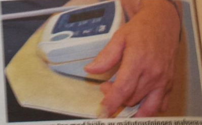
Proverna som tas med hjälp av mätutrustningen analyseras och svaren skickas digitalt till sjukstugan.

– Den 4 december har vi invigning, säger hon. Inledningsvis blir det en sågs testverksamhet.