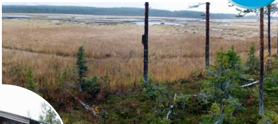
Sörmyran sedd från jaktkojans veranda

Dammen byggdes dock upp igen 2003 och våtmarken, på ca 40 hektar, räddades. Här och var finns små konstgjorda öar med lämpliga häckningsplatser för fåglar. Här finns en jaktkoja med en trevlig veranda som vätter ut mot myren. Det finns också ett vindskydd med eldstad.