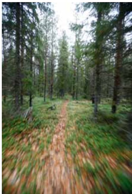
Stigen är snabb och lättvandrad.

Stigar: Stigen går över ett litet kalhygge innan skogen börjar. Väl snitslad, ca 600 m lång.