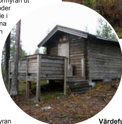
« Jaktkojan vid Sörmyran